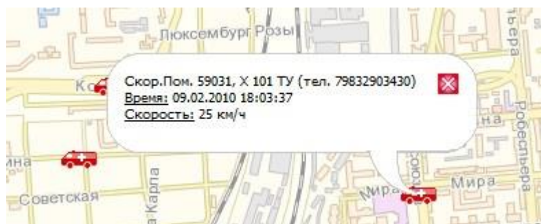
Рисунок 3 – Информация по объекту на карте.

При щелчке мышью по объекту на карте (на панели инструментов должна быть нажата кнопка «переместить карту») выводится информация по этому объекту (рисунок 3).